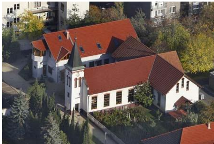
Egy légi felvétel templomunkról és a gyülekezeti házról

Április 8-9. Húsvét, úrvacsorával egybekötött ünnepi istentisztelet az énekkar szolgálatával.