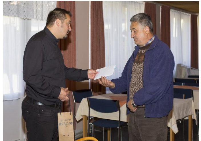
Az adomány kézbesítésének pillanata

(Részlet, Erkel Ferenc Bánk bán című operájából, Egressy Béni-eredeti szövegével).