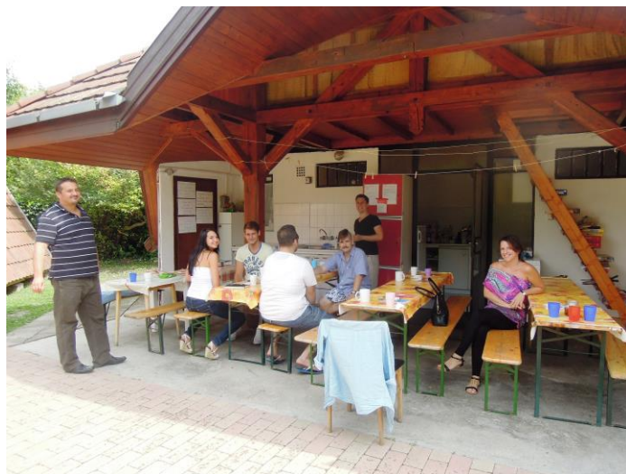
Balatonfüzfő ifitábor 2014

Augusztus 10-16. Mini ifi tábora Balatonfüzfőn.