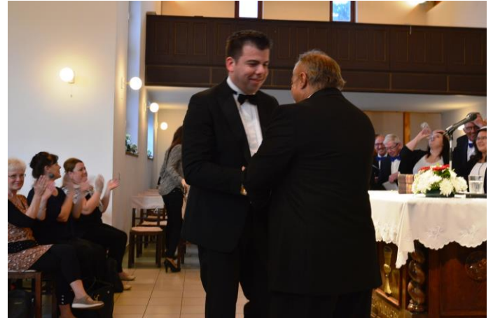
a két karnagy

Egy héttel vendégeink érkezése előtt a holland kórus állandó karnagya váratlanul felmerülő magánéleti problémák miatt lemondta a magyarországi utat. Plakátok készen, számos helyen meghirdetve mindkét esemény, minden megszervezve és megrendelve. Megijedtünk, mi lesz most? Istennek hála, hogy sikerült egy vendég karnagyot szereznünk Vincent van Dam személyében, aki hazautazván egyik levelében így írt nekünk: