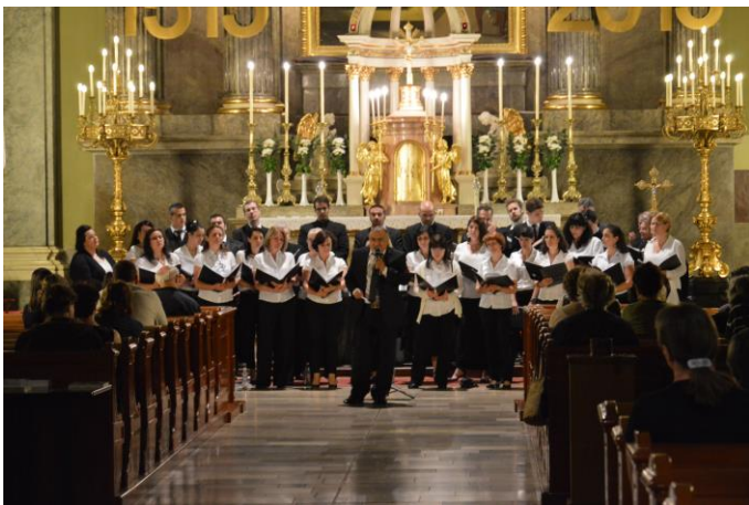
kórusunk a Terézvárosi templomban

rávilágítsanak a hit és a szakralitás közösségformáló, valamint a kereszténység nemzetépítő és megtartó erejére. Nagy megtiszteltetés volt számunkra, hogy ehhez mi is hozzájárulhattunk. Jelentős kihívások elé állított bennünket a templom akusztikája 9 másodperces visszhangjával, ami igencsak megnehezítette a művek előadását. Nem volt könnyű ezt megszokni, végül azonban mégis sikerült a fesztivál céljához méltó koncertet adnunk. SOLI DEO GLORIA!