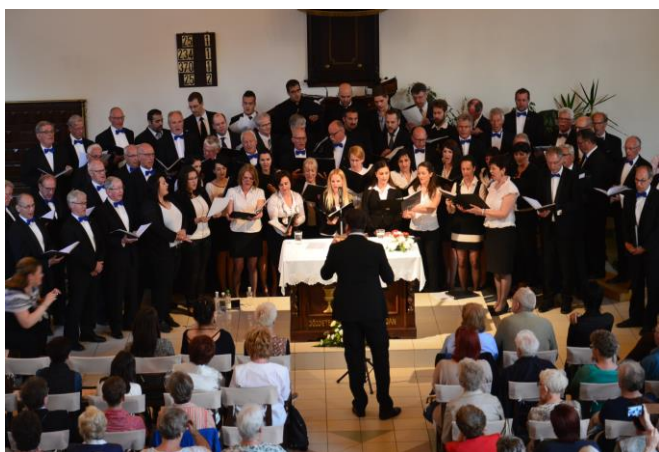
összkar, vezényel: Vincent van Dam

Külön meg kell említenem azokat az örvendező pillanatokat, amikor a hollandok magyarul majd a magyarok hollandul énekeltek így adva tiszteletet egymás nemzete iránt. A vendég kórus tagjai a metakommunikáció minden eszközével folyamatosan jelezték a koncert alatt, hogy szívük-lelkük velünk van.