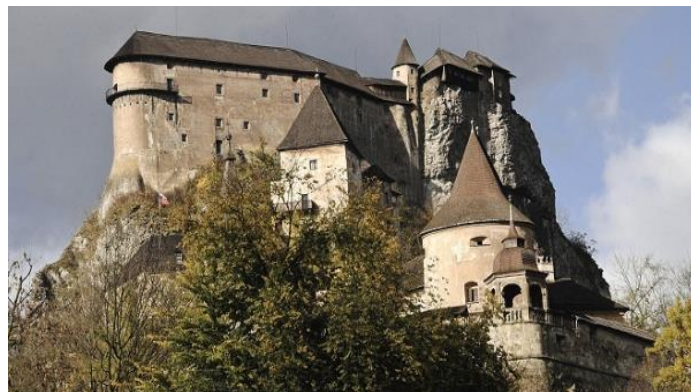
Arva vára – egyike azoknak a kőváraknak, amelyeket IV. Béla építtetett a tatárjárás után

A mongolok Batu kán vezetésével legyőzték IV. Bélát a Sajó melletti Muhinál