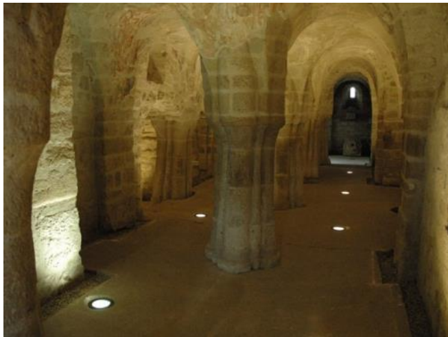
A feldebrői altemplom

Ebédünket követően a tábor zárásaképpen még tettünk egy kis kirándulást Feldebrőre, ahol a helyi Árpád-kori templomot tekinthettük meg.